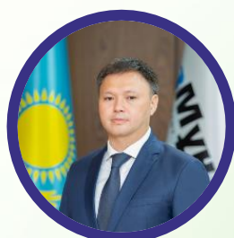
ХАСЕНОВ Асхат Галимович

Председатель Правления АО НК «КазМунайГаз»