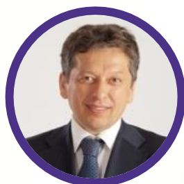
МАГАНОВ Наиль Ульфатович

Помощник Президента Российской Федерации