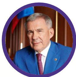
МИННИХАНОВ Рустам Нургалиевич

Заместитель Председателя Правительства Российской Федерации