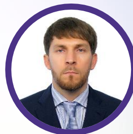
ЭДЕЛЬГЕРИЕВ Руслан Сайд-Хусайнович

Помощник Президента Российской Федерации