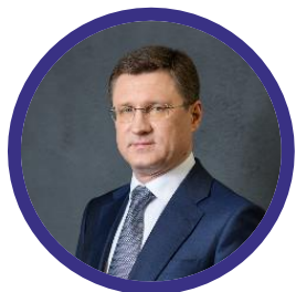
НОВАК Александр Валентинович

Заместитель Председателя Правительства Российской Федерации