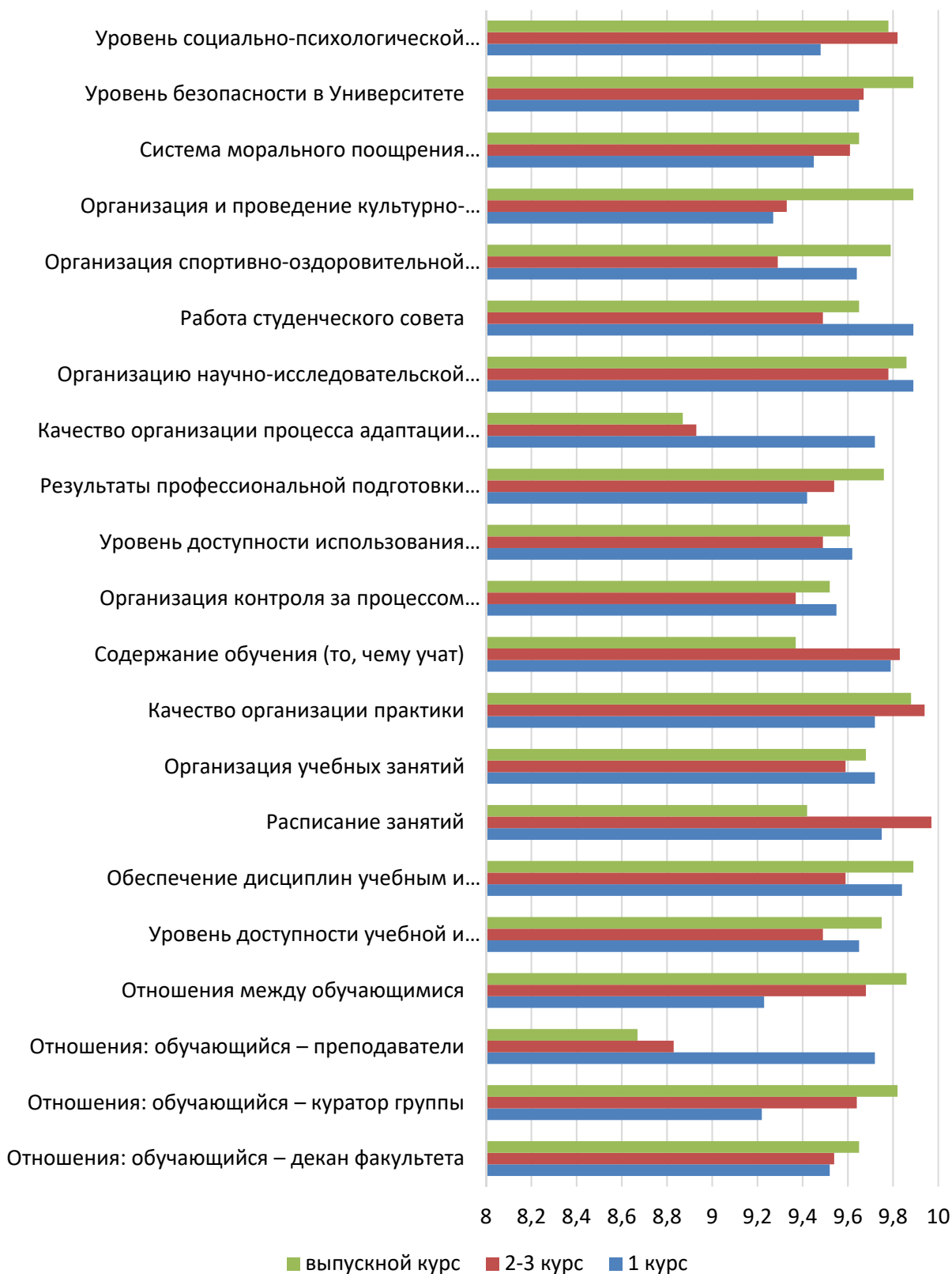
Рисунок П1 – Удовлетворенность обучающихся условиями, содержанием, организацией и качеством образовательного процесса в целом по университету