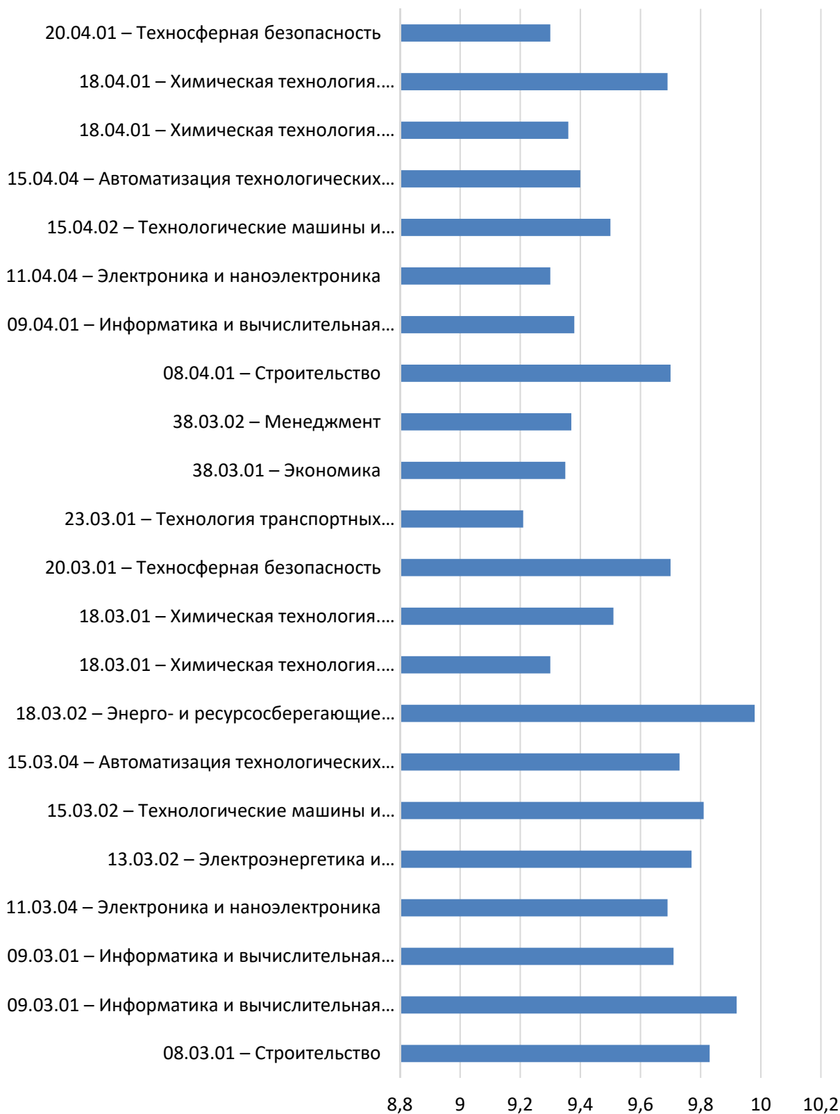
Рисунок П2 – Удовлетворенность обучающихся условиями, содержанием, организацией и качеством образовательного процесса по образовательным программам