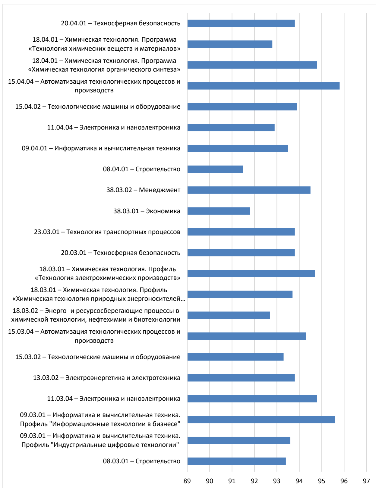
Рисунок П4 – Результаты опроса работодателей по вопросам оценки удовлетворенности качеством образования по реализуемым образовательным программам